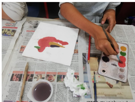
J'ai peint un rapace.